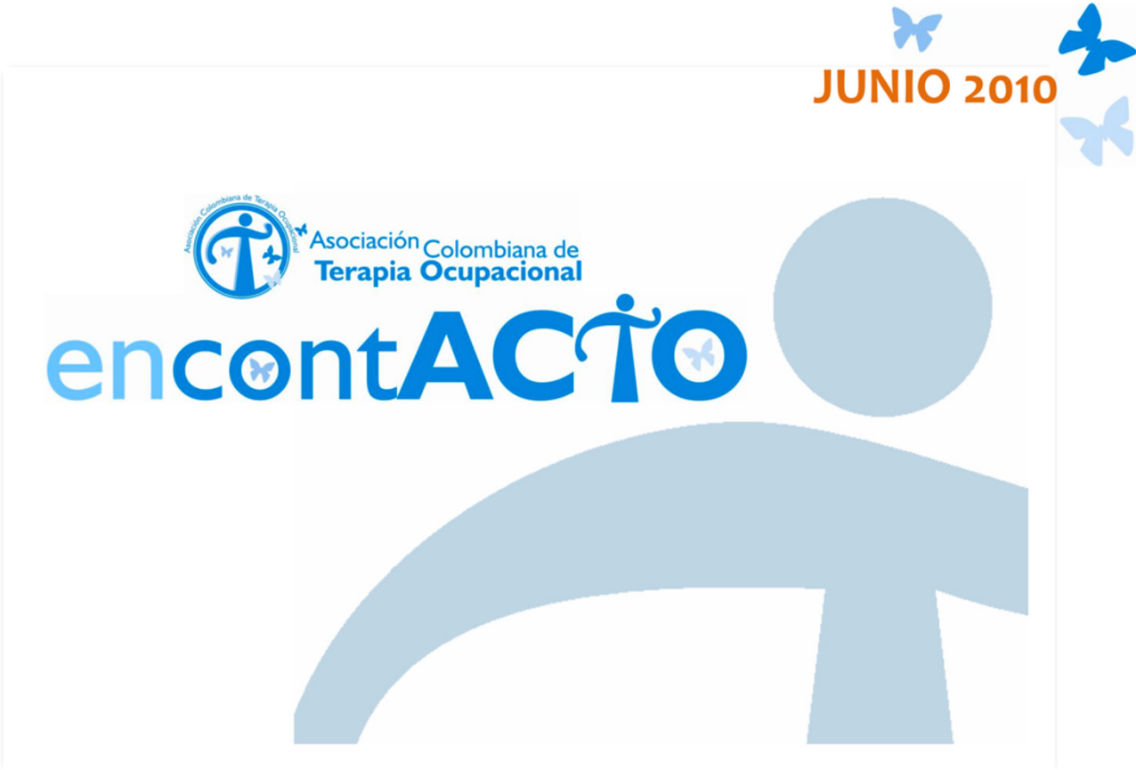
Figura 1. Captura de la portada del boletín encontACTO, junio de 2010